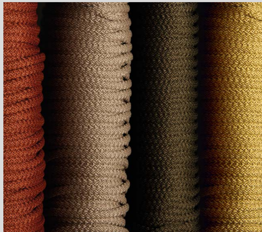
Rope color details Detalle colores cuerda

Estiu combina la técnica de cuerda con el algodón de una pantalla cilíndrica de sujeción interna que parece flotar en el aire. Su luz y forma nos traslada a un anochecer de verano donde los farolillos son los protagonistas. Disponible en varios tamaños, colores y con la posibilidad de la realización de diferentes combinaciones.