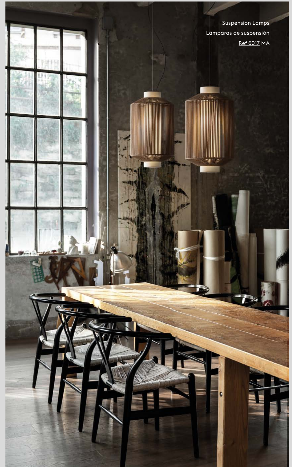
Suspension Lamps Lámparas de suspensión Ref. 6017 MA